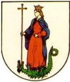
Gemeindefappen Heimbach 1950-1960 Gemeindefappen Heimbach-Weis 1960-1970