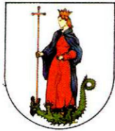
Gemeindewappen Heimbach 1950-1960 Gemeindewappen Heimbach-Weis 1960-1970