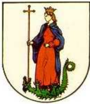
Gemeindewappen Heimbach 1950-1960 Gemeindewappen Heimbach-Weis 1960-1970